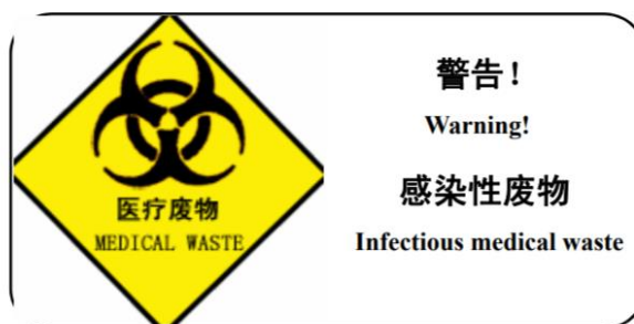
图 1 带警告语的警示标志