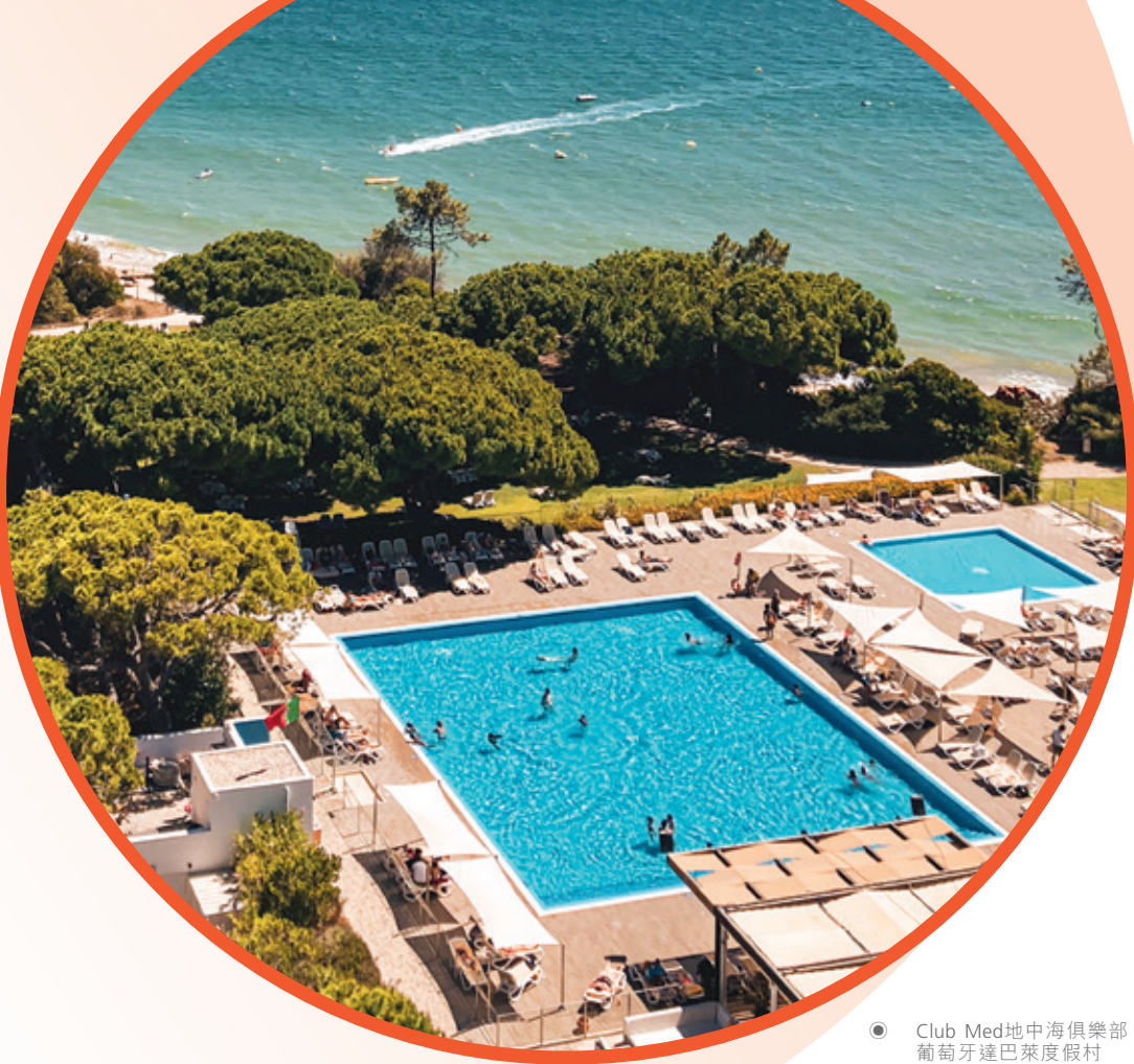
● Club Med地中海俱樂部·葡萄牙達巴萊度假村

2023年，主要受益於歐非中東及巴西的客戶推動山地業務大幅增長，Club Med業績創新高。於2022年強勁復甦之後，美洲業務持續良好表現，亞太地區則於旅行限制取消後出現強勁反彈。繼中國於疫情後全面放開，中國國內旅遊在2023年出現反彈。