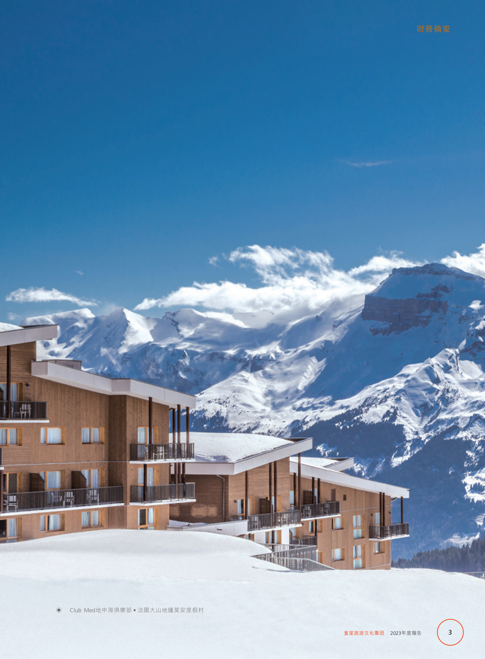
● Club Med地中海俱樂部 • 法國大山地薩莫安度假村