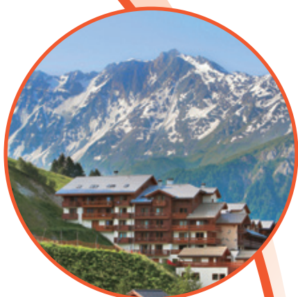
● Club Med地中海俱樂部•法國佩西瓦蘭德里度假村