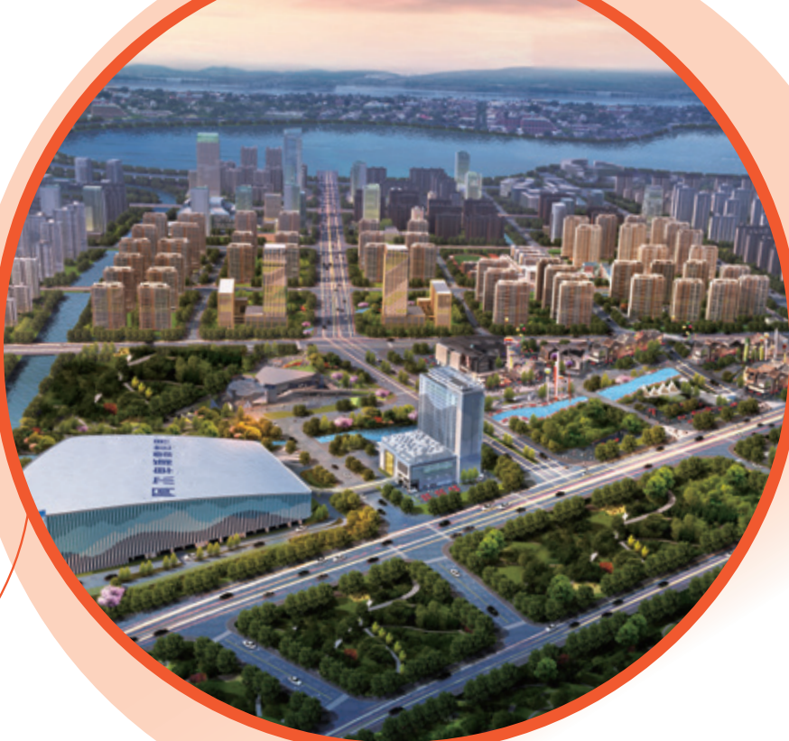
● 太倉阿爾卑斯 國際度假區 • 中國