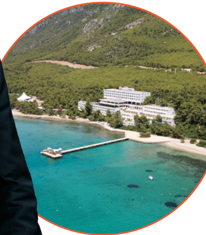
● Club Med地中海俱樂部 • 希臘愛琴海格雷高里曼諾度假村

歷經三年疫情的挑戰，2023年我們終於迎來了全球旅遊業的整體復甦。得益於我們不斷優化的產品組合以及全體員工堅持不懈的努力，复星旅文在2023年實現了扭虧為盈，核心業務更是創出歷史新高。同時，我們的收入結構顯著優化，旅遊運營貢獻的收入佔比超過93%。這一轉變不僅證明了我們聚焦於輕資產運營戰略的有效落實，也為集團的未來的可持續增長奠定了堅實的基礎。