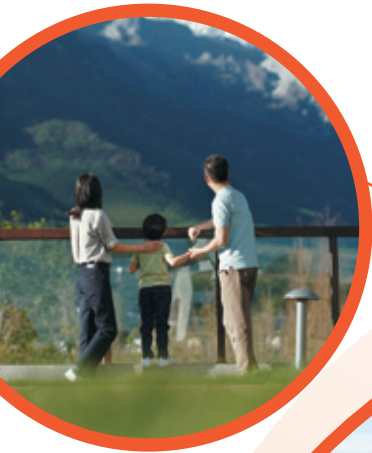
● 麗江地中海國際度假區 • 中國

麗江地中海國際度假區已於2021年9月25日開業。2023年，隨著疫情放開及旅遊行業復甦，麗江地中海國際度假區迎來客流高峰。五一假期期間，麗江地中海國際度假區聯同復星基金會通過「音樂+公益」的模式舉辦簡單假日生活節，實現1,500萬次推廣曝光，累計吸引近萬人參與。6